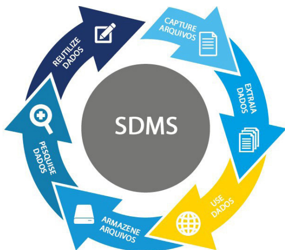
Fig. 2: Visão geral do SDMS

A redução e a automação da entrada de dados melhoram a qualidade e economizam tempo.