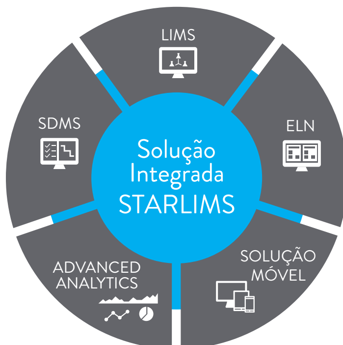
Fig. 1 - Otimize o acesso ao gerenciamento de dados e a integridade com nossa plataforma única