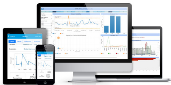
Fig. 3: Painéis de solução móvel e análises avançadas STARLIMS

As soluções de análises avançadas permitem a visualização de dados com gráficos relevantes para eles. Há muitos tipos de gráficos disponíveis e a solução orienta você a escolher a melhor visualização com base no conjunto de dados existente. Por exemplo, dados com uma localização geográfica talvez sejam visualizados melhor em um mapa. Gráficos de dispersão são úteis para a visualização de conjuntos de dados grandes e a procura de valores atípicos nesses dados. Gráficos de barras e gráficos de pizza são úteis para comparação. A visualização dos dados nesse tipo de ferramenta permite que o usuário perceba informações que escapariam a ele e seriam difíceis de identificar em uma planilha ou